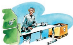
Flexibelt stativ inom tillverkningsindustrin.