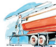
Lätt och flyttbar arbetsplattform.