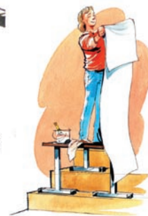
Arbetsplattform vid t ex tapetsering eller målning.